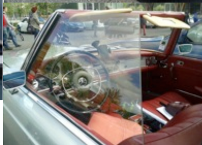
Mercedes 250 cabriolet.